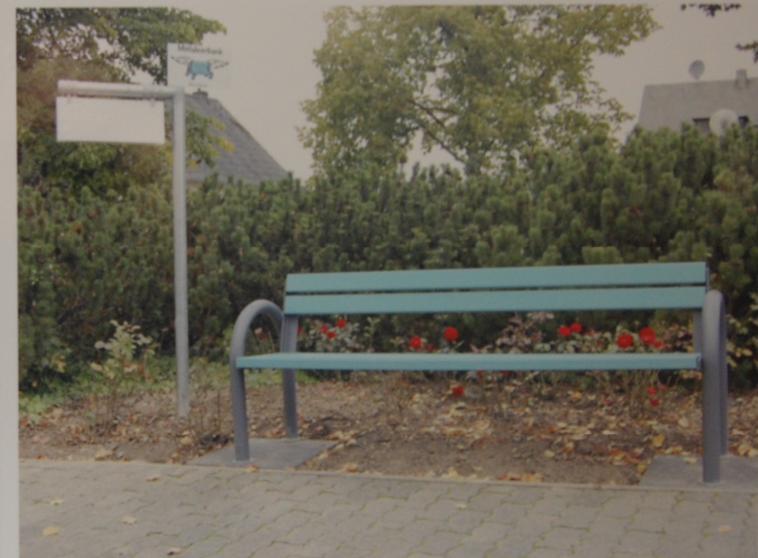
Mitfahrerbank (Designteam: Caritasverband Westeifel e. V. als Träger der Anlaufstelle für Senioren in der VG-Speicher)

Vor dem Rathaus der Stadt Speicher steht seit Kurzem eine türkisfarbene Bank. Wer sich daraufsetzt, dem kann es passieren, dass ein Auto anhält mit der herzlichen Aufforderung: Bitte einsteigen! Auch wenn dies auf den ersten Eindruck ungewöhnlich bis riskant klingt – die Mitfahrerbank soll sicheres Trampen ermöglichen. Auf einem fest angebrachten Klappschild kann man, ähnlich wie beim Trampen, anzeigen, wohin man reisen möchte. Zum Bahnhof zum Beispiel. Oder in die nächstgelegene Stadt, hier Bitburg. Plant ein Autofahrer, dorthin zu fahren, und hat noch einen Platz frei, so kann er anhalten