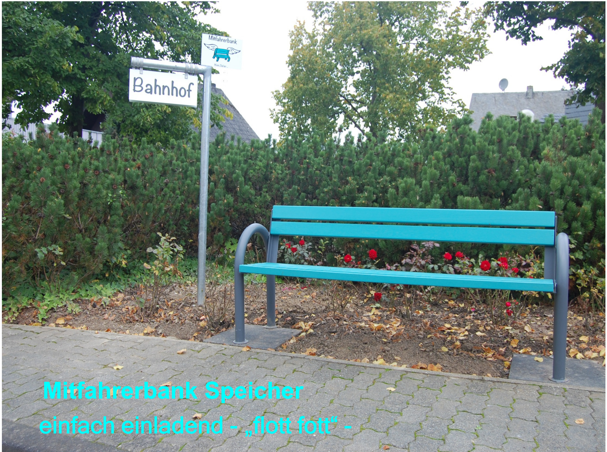
Mitfahrerbank Speicher einfach einladend - „flott fott“ -