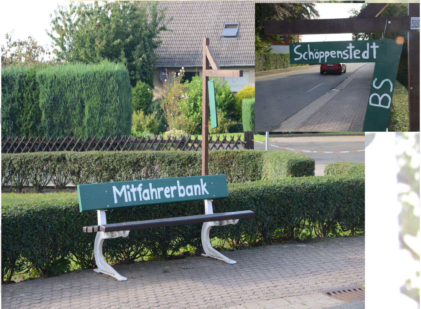
Mitfahrerbank in Veltheim/Ohe (Ost-Niedersachsen) – eine alte Bank recycled, einfache Beschilderung zum Hochhängen